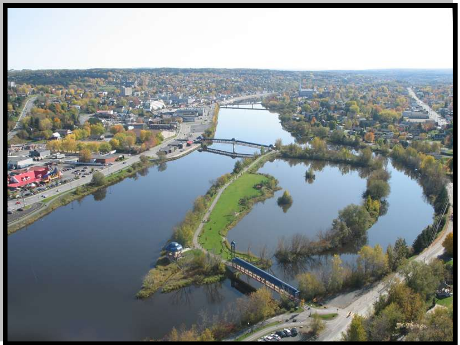
Saint-Georges, Québec, CANADA