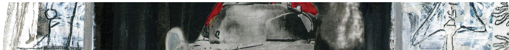
Photo en page couverture : Sylvie Pilotte, L'invasion , (2017) Collage, acrylique et crayon feutre sur bois aggloméré, diamètre 13,75"